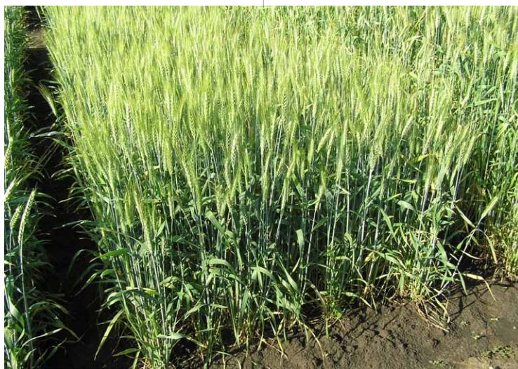
Фото 1. Вигляд озимої пшениці, обробленої фунгіцидом Аканто® Плюс, 0,6 л/га, 2016 рік

Підбиваючи підсумки 2017 року, зазначимо, що Аканто® Плюс черговий раз довів свою цінність для виробничника, забезпечуючи високий результат та інвестиційну окупність застосування. Ми неодноразово згадували, що Аканто® Плюс був створений на основі одного з крапчих стробілуринів – пікоксістробіну. Обираючи Аканто® Плюс, виробничник отримує весь пакет переваг, пов'язаних з надійним контролем хвороб силою вираженого фізіологічного ефекту, тривалістю захисної дії та унікальною паровою фазою.