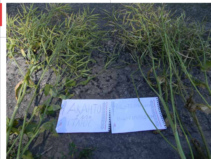
Фото 5. Більш рівномірне дозрівання стручків ріпаку після застосування Аканто® Плюс

Для багатьох господарств цінність Аканто® Плюс на ріпаку є очевидною. По-перше, завдяки фунгіциду досягається ефективний