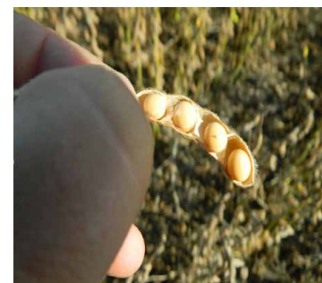
Фото 2. Рівномірна фракція зерен після обробки Аканто® Плюс на час збирання

Безперечних переваг Аканто® Плюс надає пікоксістробін, який є найкращим представником групи стробілуринів. Саме завдяки пікоксістробіну продукт націлений на високий урожай та його якість. Ця діюча речовина швидко проникає в рослину та має як системні властивості, так і трансламінари. Крім цього, у пікоксістробіну є «паровий ефект», що особливо актуально у разі загущених посівів або при забез-