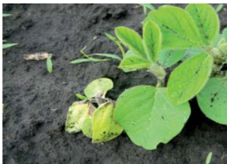
Дія Хармоні ® 8/га + ПАР Тренд ® 90 проти падалиці соняшнику. Київська обл., 2014 р.

Насамперед захист культури спрямований на знищення бур'янів, і в цьому питанні компанія «Дюпон» є одним із лідерів, адже саме вона представила