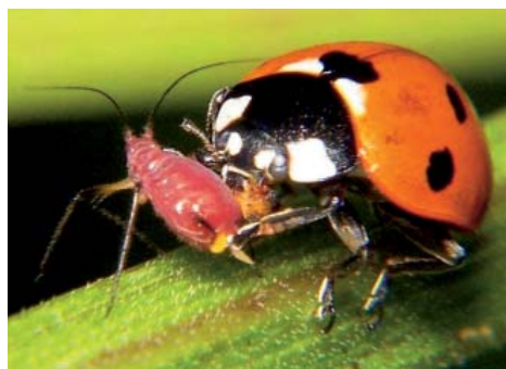
Інсектицид Кораген ® має високі показники безпечності для бджіл, джмелів, кокцинелід та інших корисних комах

Компанія «Дюпон» рекомендує розпочати профілактичну обробку сої Аканто