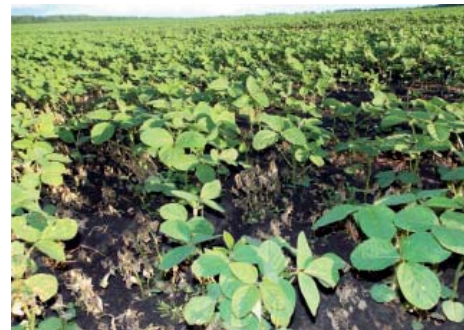
Дія Хармоні ® 7/га + д. р. бентазон 2,0 л/га + ПАР Тренд ® 90 на види лободи та щиріці. Сумська обл., 2014 р.

Значна кількість виробників використовує препарат у системі двох послідовних внесень: перший раз — на ранніх етапах розвитку сої проти падалиці соняшнику, видів лободи, гірчаків (сім'ядолі — перша пара листків), а згодом, у разі появи нової хвилі, проводять другу обробку. До речі,