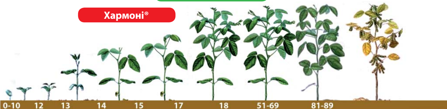
Схема захисту сої